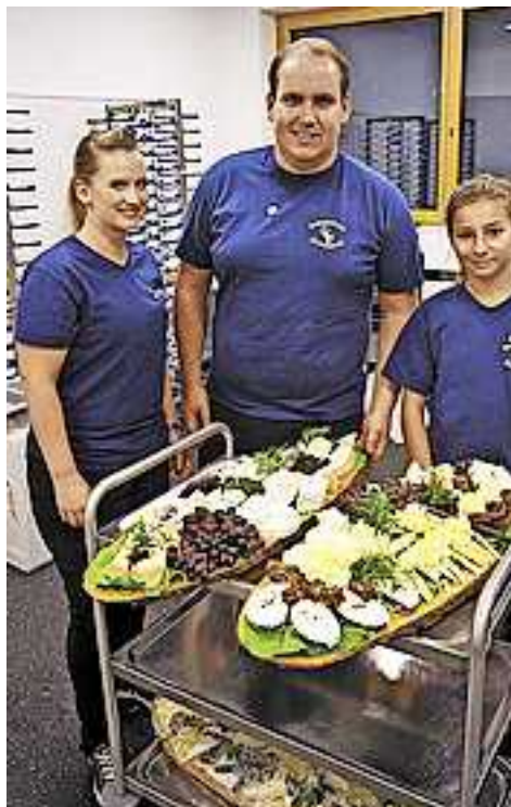
Beste Verpflegung durch die Unterkliener Faschingszunft aus Hohenems

Die zahlreichen Helfer des Bezirksmusikfestes folgten der Einladung des Musikvereins zum großen Dankesfest ins KOM.