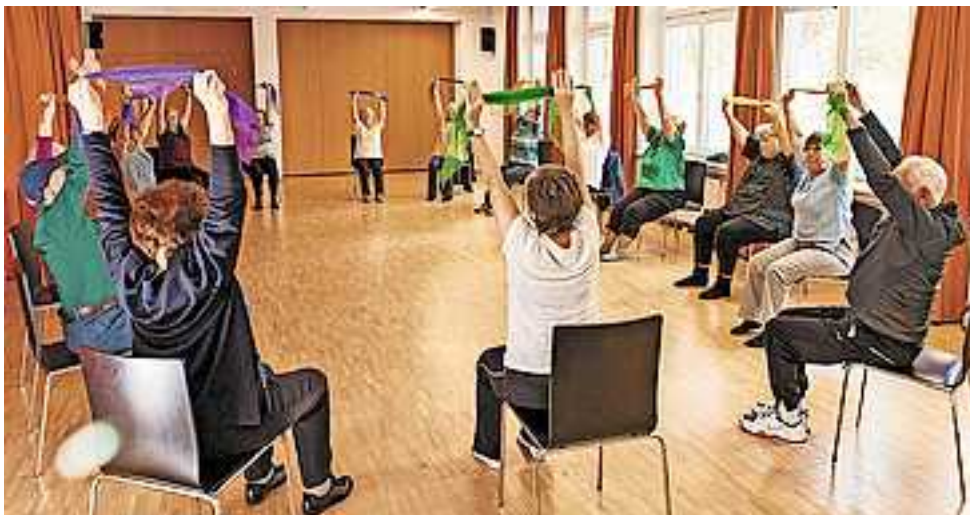
Infos unter www.sicheresvorarlberg.at

Information und Beratung zu den Bewegungsangeboten erhalten Interessierte bei „Sicheres Vorarlberg“, Tel. 05572/54343-44 oder E-Mail info@sicheresvorarlberg.at !