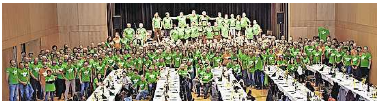
Rund 500 Helfer folgen der Einladung zum Dankesfest ins KOM