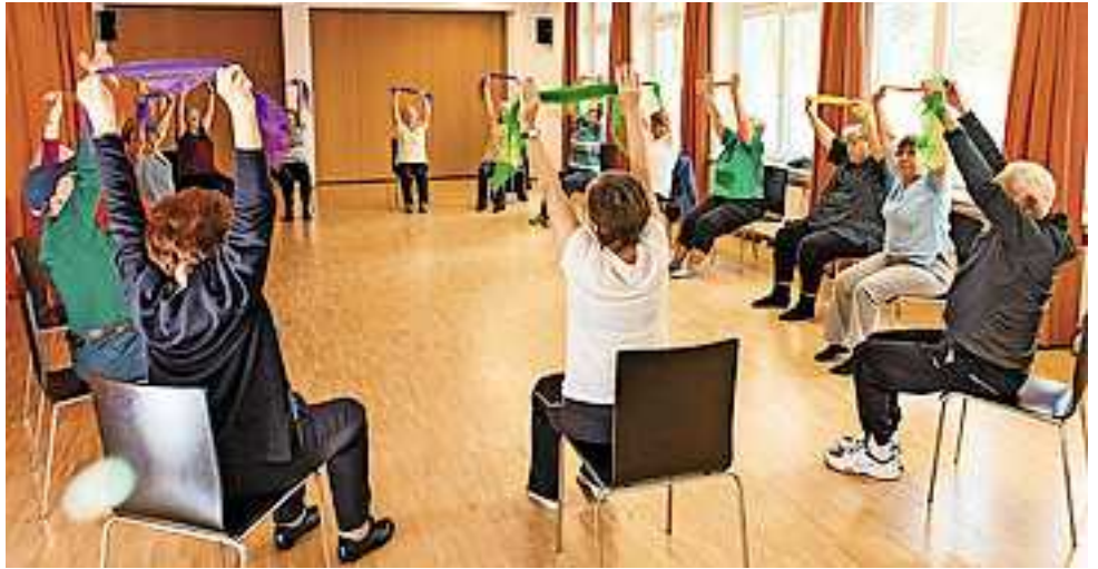
Weitere Infos unter www.sicheresvorarlberg.at