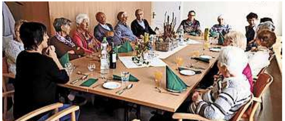
Das nächste gemeinsame Mittagessen findet im Sozialzentrum statt.