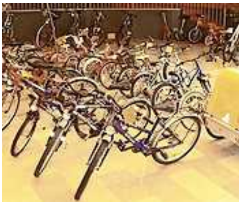
Der Elternverein lädt am kommenden Samstag zum Räder- und Freizeitbasar

Der Basar findet heuer am Samstag, den 9. März zwischen 10.00 und 11.00 Uhr in der Aula der Volksschule statt. Der Elternverein lädt ein, gut erhaltene Freizeitartikel zu verkaufen bzw. zu erwerben. Zum Basar angenommen werden Fahrräder, Einräder, Dreiräder, Fahrradanhänger, Kindersitze, Rollerblades, Skateboards, Schutzausrüstung und Sporthelme, Trittroller, Scooter, Traktoren, Rutschautos, Bobby Cars, Tennis-, Hockey- und Tischtennisschläger, Fußballschuhe, Taucherbrillen, Kletterausrüstung oder auch Reitzubehör. Bitte keine Sommerbekleidung!