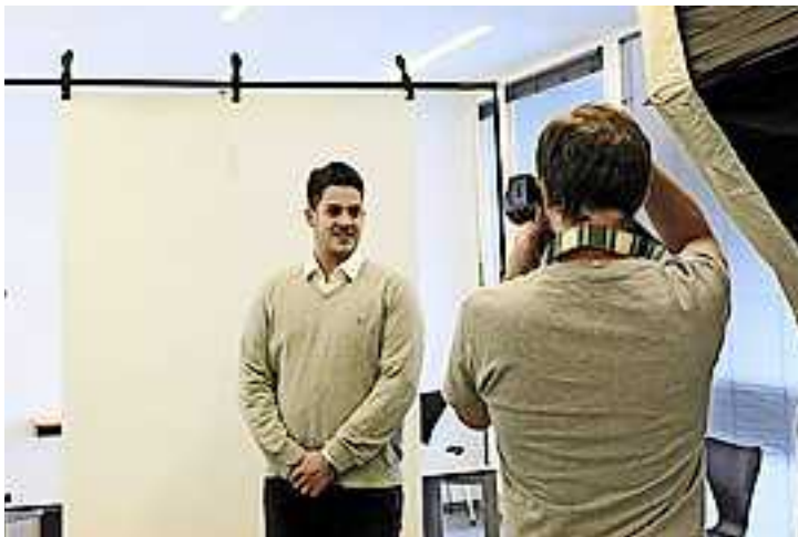
Alle Infos unter www.aha.or.at/bewerbungsfoto

Einzelpersonen ohne Anmeldung, für Gruppen ab fünf Personen ist eine Anmeldung notwendig.