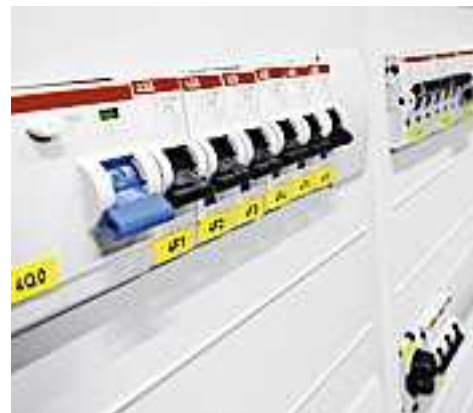
Weitere Infos unter www.sicheresvorarlberg.at

Wichtig: löst der FI-Schalter nicht mehr aus oder bleibt hängen, ist eine sofortige Reparatur erforderlich. Diese sollte von einem Elektrofachmann durchgeführt werden.