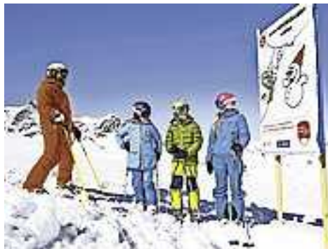
Weitere Infos unter www.sicheresvorarlberg.at

Der Folder „Sicheres Schifahren“ beinhaltet die Pistenregeln, die Beschreibung der wichtigsten Beschilderungen im Schigebiet und enthält