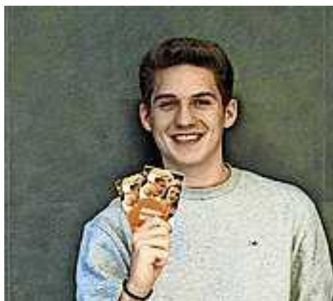
Weitere Infos unter www.aha.or.at/jugendschutz-und-kinderrechte

Dieser kann im aha abgeholt oder unter E-Mail aha@aha.or.at bestellt werden.