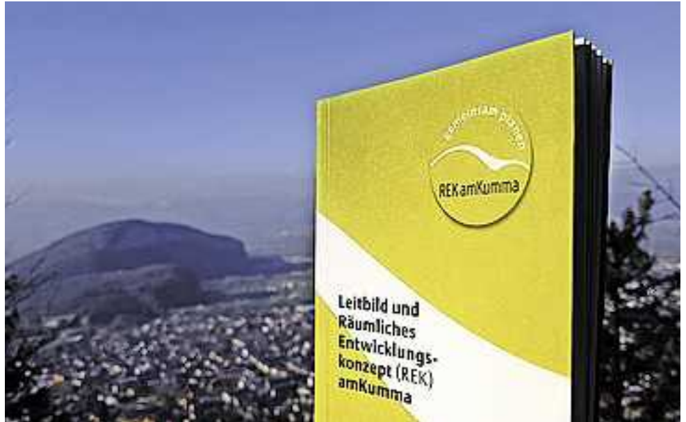
Im kommenden Jahr wird die Region amKumma gemeinsam mit der Bevölkerung die Leitlinien für die künftige Entwicklung festlegen.

Den Stellenwert der Zusammenarbeit über die Gemeindegrenzen hinaus, haben die Mitgliedsgemeinden der Region amKumma bereits früh erkannt. 2007 wurde ein gemeinsames Leitbild beschlossen und ein regionales Entwicklungskonzept (regREK) ausgearbeitet. Die interkommunale Zusammenarbeit ist seither stetig gewachsen. Der Blick über die Regionsgrenzen hinweg hat in vielen Projekten in konkreter Zusammenarbeit mit Nachbargemeinden und Regionen ge- fruchtet.