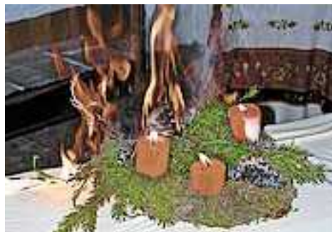
Weitere Informationen unter www.sicheresvorarlberg.at