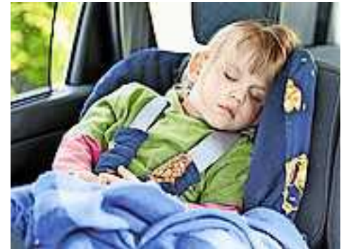
Weitere Infos unter www.sicheresvorarlberg.at

Im Normalfall wird der Gurt knapp vor einem Zwischenfall ein paar Zentimeter zurückgezogen. Das verhindert, dass der Körper in den Gurt fällt. Damit konnten einige schwere Verletzungsmuster eliminiert werden. Tragen die Fahrzeuginsassen eine dicke Jacke, zieht das System zwar auch zurück, aber die Wirkung ist durch den Abstand, den eine voluminöse Über-