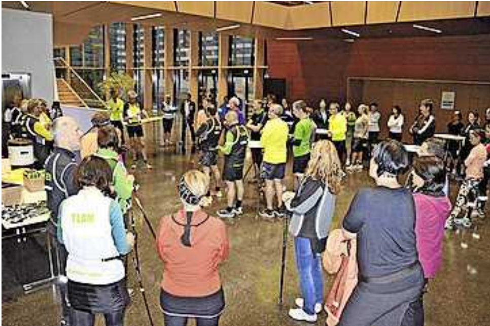
Der Bewegungstreff in Altach war immer gut besucht

In Altach werden die Bewegungstreffs immer vom Verein lauf.mit Altach organisiert. Insgesamt durften in diesem Jahr 376 Teilnehmende aller Leistungsklassen zum gemeinsamen Training begrüßt werden. Die Lauftreffs dienen als Vorbereitung zum traditionellen Altacher Odlo Silvesterlauf. Dieser wird in diesem Jahr bereits zum 21. Mal veranstaltet und findet am Sonntag, den 30. Dezember ab 10 Uhr beim KOM Veranstaltungszentrum statt. Online-Anmeldungen sind noch bis zum 19. Dezember auf www.altacher-silvesterlauf.at möglich.