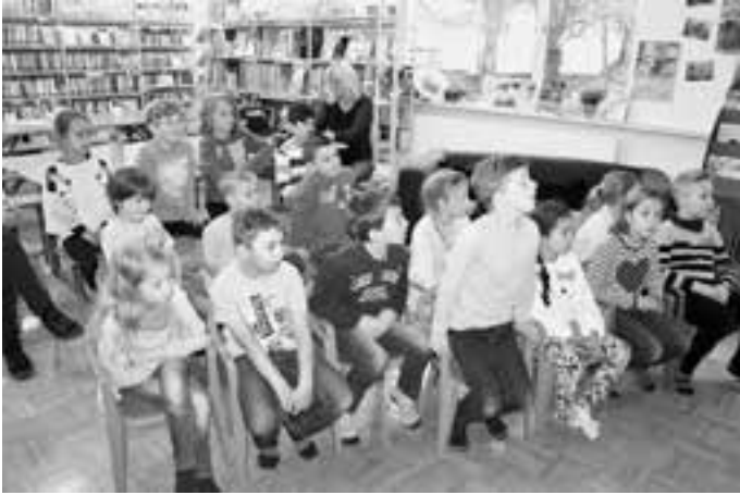
Gespannt folgten die Kinder den Worten der Autorin.

welches erstmals Urlaub am Meer machte und Freundschaft mit einem kleinen Fisch schloss. Um die Geschichte „Die Rabenrosa“ vorzustellen, bediente sich die Autorin eines Kamishibais, hinterlegte die Erzählung mit einem selbstkomponierten Lied und brachte ein Nest mit Eiern und kleine Rabenpuppen zum Einsatz. Dieser interaktiven Präsentation folgten die Kinder mit hoher Konzentration und aktiver Mitarbeit. Im Anschluss durften die Schüler/innen ein eigenes Nest basteln, mit angemalten Eiern und einer eigenen „Rabenrose“, „Rabengrün“ oder wie die Kinder ihre Eigenkreation nennen wollten, bestücken.