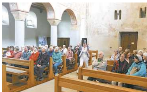
In der romanischen Kirche St. Georg

alten Mesmer“ ausgezeichnet zu Mittag gegessen. Die anschließende kulturelle Führung begann bei der noch im romanischen Stil erhaltenen St. Georgskirche. Mit großer Begeisterung erläuterte die erfahrene Kunstführerin die hier bestens erhaltenen monumentalen Wandgemälde und Ornamentbänder. Bei der weiteren Rundfahrt über die Insel fielen besonders die unzähligen Gewächshäuser und Salatfelder auf. Dies zeigt – neben dem Weinbau und dem Tourismus – die Bedeutung des Gemüseanbaus auf der Insel in heutiger Zeit. Bei der Rückfahrt wurde in Konstanz noch ein Zwischenstopp eingelegt, wo so manche und mancher mit einem großen Eis dem Eisheiligen Servatius dankte, dass wir so einen angenehmen Tag in diesem Herzstück des Bodensees erleben durften.