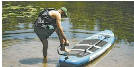
Auch Paddeln birgt einige Gefahren

Schätze dein Können realistisch ein und wähle ein stabiles Board, besonders als Anfänger.