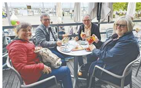
Dem Eisheiligen Servatius wurde auch gehuldigt