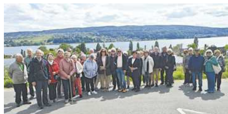
Ein Teil der Reisegruppe und Blick von der Hochwart in die Schweiz