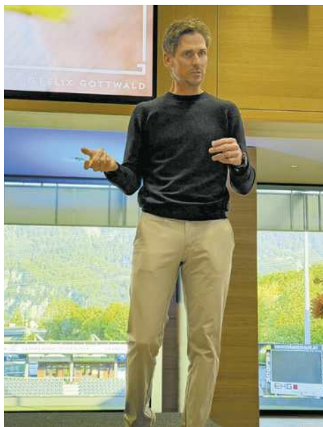
Felix Gottwald gab Einblicke in seine erfolgreiche Karriere

Gottwald verstand es von Beginn an, die Zuhörenden mitzunehmen. Ohne große Inszenierung, dafür mit viel persönlicher Erfahrung sprach er über Themen aus dem Leben. Seine Einblicke waren dabei nicht nur sportlich geprägt, sondern ließen sich gut auf den Arbeitsalltag übertragen. Besonders blieb hängen, dass