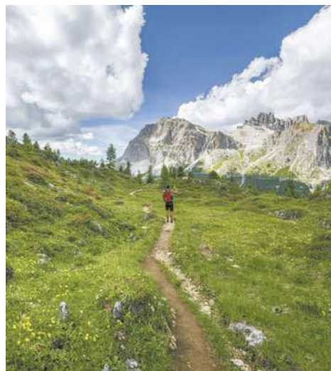
Mit „PEAK“ sicher auf den Berggipfel

Mit dem PEAK-Bergcheck hast du ein einfaches, strukturiertes Werkzeug zur Orientierung, das dich von der Vorbereitung bis zur letzten Minute der Wanderung begleitet – und dafür sorgt, dass du sicher wieder heimkommst.