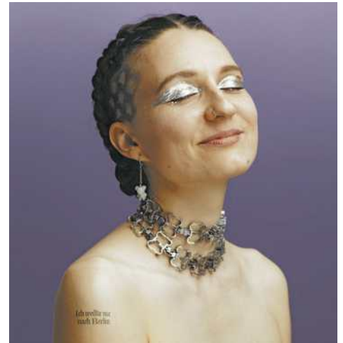
NNELLA hat eine neue EP veröffentlicht

zu hören: Am Samstag, den 18. April, gastiert sie mit ihrem neuen Programm im Vogelfreiraum in Rankweil.