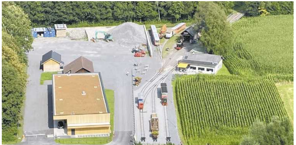
Luftbild Gelände Steinbruchseite nach dem Umbau

„Diese Auszeichnung ist nicht nur eine Anerkennung für das Projekt selbst, son-