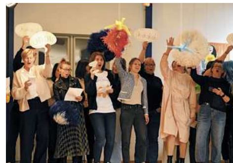
Auch das Lehrerkollegium hatte eine Einlage vorbereitet