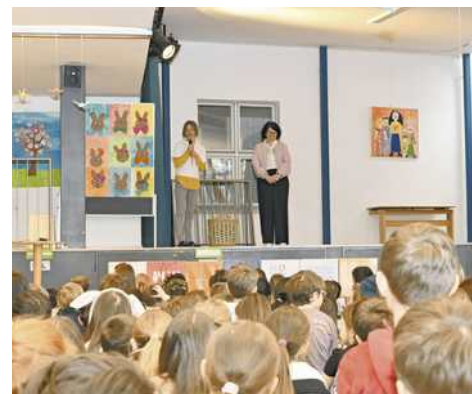
Die Aula der Volksschule war bis auf den letzten Platz gefüllt