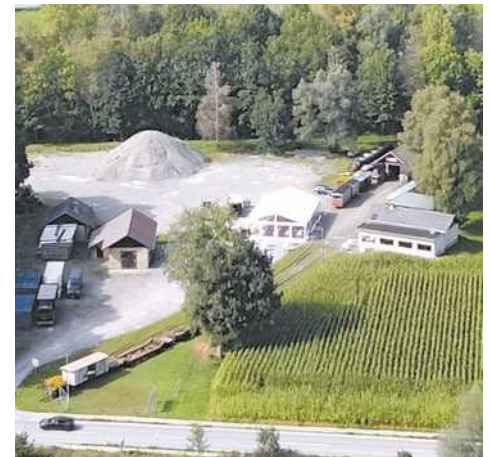
Luftbild Gelände Steinbruchseite vor dem Umbau

Der Österreichische Bahnkultur-Preis wird alle zwei Jahre verliehen, um herausragende Leistungen im Bereich der Erhaltung von Schienenfahrzeugen, Bahnanlagen und der Vermittlung von Bahngeschichte zu würdigen. Die Fachjury bewertet dabei unter anderem die historische Genauigkeit, die handwerkliche Qualität und die Bedeutung für die Öffentlichkeit.