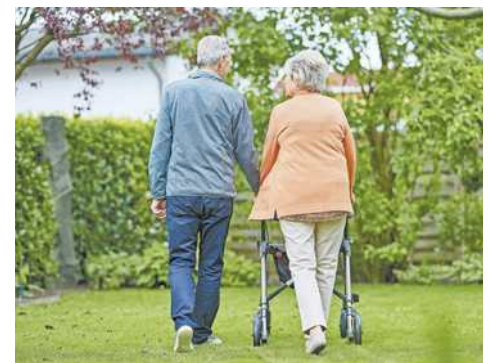
Lebenswert älter werden.

Für weitere Tipps für ein selbstbestimmtes Älterwerden steht die Broschüre LEBENSWERT ÄLTER WERDEN zum Download auf sicheresvorarlberg.at oder zur Bestellung über info@sicheresvorarlberg.at bereit. Zudem organisiert Sicheres Vorarlberg auf Anfrage Vorträge zur Sturzprävention. Infos online oder bei Sandra König: sandra.koenig@sicheresvorarlberg.at , Tel. 05576 94141-12.