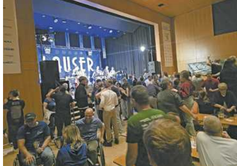
Die Lauser sorgen auch in diesem Jahr wieder für Stimmung

Vom 20. bis 22. März 2026 findet in Altach die 46. Auflage des Internationalen MOHREN Rollstuhlbasketballturniers statt. Seit über 45 Jahren bietet die Veranstaltung eine besondere Kombination aus Sport, Unterhaltung und Begegnung.