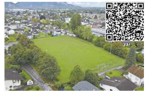
QR-Code scannen und an der Umfrage teilnehmen.

Ein wesentlicher Bestandteil der Masterplan-Erarbeitung ist die Einbindung der Bürger. Über eine digitale Umfrage möchte die Gemeinde Altach erfahren, welche Bedürfnisse es in Bezug auf Spiel-, Freizeit- und Erholungsräume gibt und welche Ideen die Bevölkerung für die Zukunft des Riedle-Areals hat. Zudem analysieren Fachplaner das bestehende