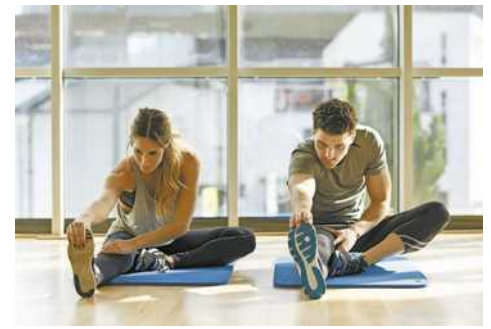
Aufwärmen nie vergessen!