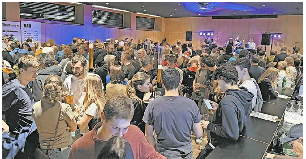
Die Liveband „6feet2“ sorgt bei der After-Race-Party für ordentlich Stimmung

Nach den sportlichen Aktivitäten wartet ein weiteres Highlight: die große After Race Party mit der Liveband „6feet2“. Hier können alle Läuferinnen, Läufer und Zuschauer gemeinsam feiern und bei ausgelassener Stimmung das Jahr verabschieden. Die Veranstaltung bietet somit nicht nur eine sportliche Herausforderung, sondern auch jede Menge Spaß und gute Laune.