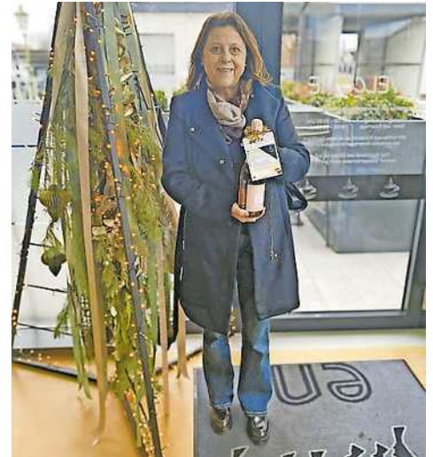
Beatrix freute sich über einen 300-Euro-Tankgutschein.