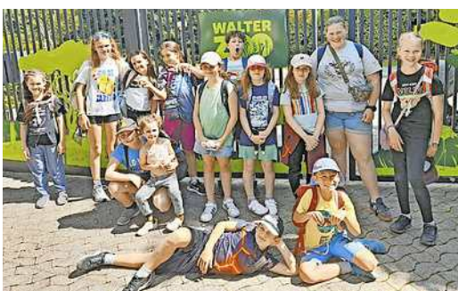
Der Altacher Sommer bot ein abwechslungsreiches Programm

Auch 2025 bot Altach ein abwechslungsreiches Freizeitprogramm: Hobby- und Kunstausstellung, bestens besuchte „Sommer im Dorf“-Konzerte, große Märkte (Gartenmarkt, Weihnachtsmarkt, wöchentlichen Genussmärkte) sowie Yoga-Core-Stunden. Für 2026 sind bereits neue Highlights geplant.