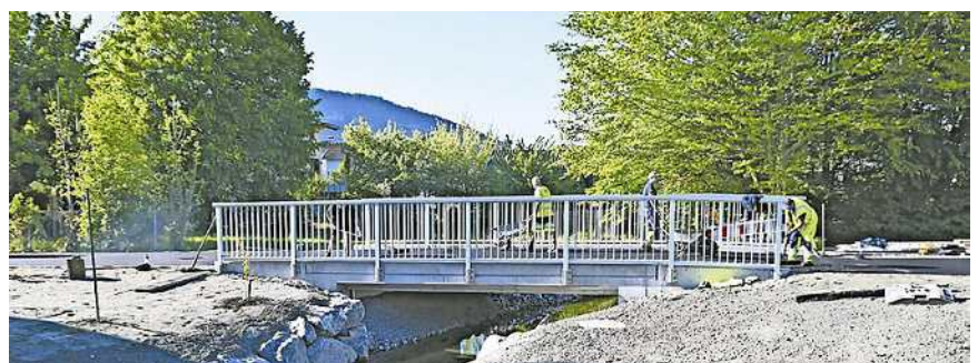
Verbesserter Hochwasserschutz im Bereich Siedlung