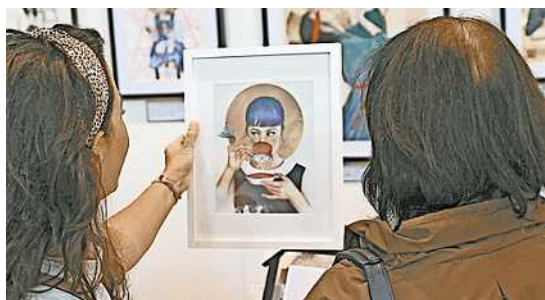
Die Hobby- und Kunstausstellung hatte viel zu bieten