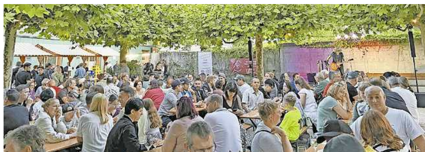
Beim Sommer im Dorf ging die Post ab