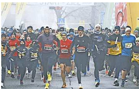
Zahlreiche Läufer nutzen den Silvesterlauf auch heuer für einen sportlichen Jahresabschluss

Teilnehmende können aus verschiedenen Strecken wählen: Für Laufbegeisterte gibt es den kurzen Lauf über sechs Kilometer oder den langen Lauf über zwölf Kilometer. Wer im Team antreten möchte, kann sich für den Staffelnbewerb entscheiden. Auch Nordic Walking-Fans kommen auf ihre Kosten und können die drei Kilometer lange Strecke genießen. Für die jüngsten Teilnehmer wird ein spezieller Kinderlauf angeboten.