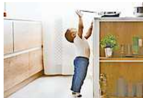
Weitere Infos unter www.sicheresvorarlberg.at.