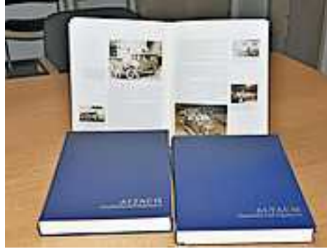
Das Altach-Buch ist beim Bürgerservice im Gemeindeamt erhältlich.