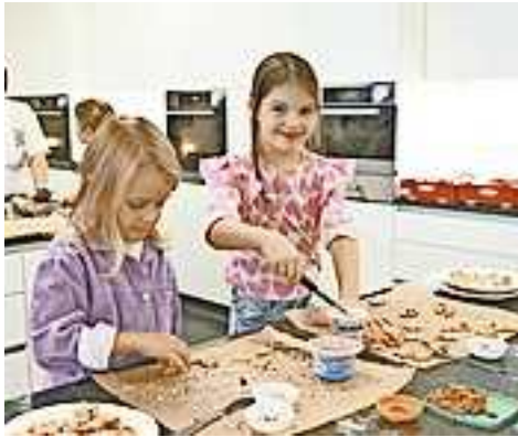
Kinder kommen in der Weihnachtsbäckerei voll auf ihre Kosten

Am Samstag, den 22. November, lädt die Gemeinde Altach von 12 bis 20 Uhr zum 18. Weihnachtsmarkt ins Veranstaltungszentrum KOM. Besucher dürfen sich auf ein stimmungsvolles Erlebnis freuen, das Kunst, Handwerk und weihnachtliche Atmosphäre vereint.