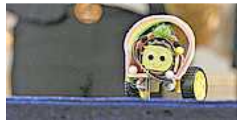
DanceBots Roboter (Beispiel eines MINT-Workshops in Kooperation mit der ETH Zürich der Region Vorderland/amKumma)

Auch die MINT-Region Vorderland amKumma erhielt dabei das begehrte Qualitätslabel und gehört nun offiziell zu den österreichweit zertifizierten MINT-Regionen. Die Region steht unter dem Motto „Entdecken – Experimentieren – Erforschen“ und fördert praxisnahe, altersgerechte MINT-Bildung vom Kindergarten bis ins Erwachsenenalter. Ziel ist es, besonders junge Menschen