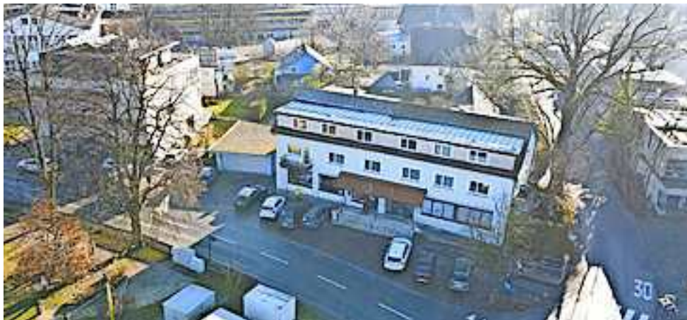
Der Postpartner befindet sich weiterhin im Gebäude in der Schweizerstraße 11

Die Öffnungszeiten des Geschäfts sind kundenfreundlich gestaltet: Montags bis freitags hat das „Kumm lädala“ von 8.00 bis 12.00 Uhr und von 14.00 bis 18.00 Uhr geöffnet. Samstags stehen die Türen von 8.00 bis 12.00 Uhr offen. Einzige Ausnahme bleibt der Mittwochnachmittag, welcher in Zukunft geschlossen bleibt. Neben dem postalischen Service dürfen sich Kunden auf ein abwechslungsreiches Sortiment freuen. „Wir laden alle ein, vorbeizu-