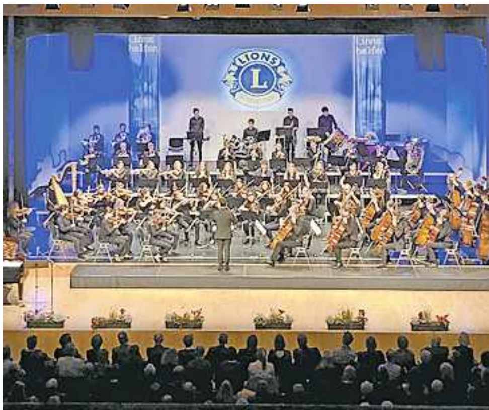
Der Reinerlös ermöglicht Soforthilfe für in Not geratene Menschen und unterstützt karitative und kulturelle Projekte der Region.

Tickets erhalten Sie im Vorverkauf (Erwachsene: 30 Euro; Schüler/Studenten: 15 Euro) unter https://ambach.jetticket.net , E-Mail tickets@ambach.at oder Tel. 05523/64060-11.