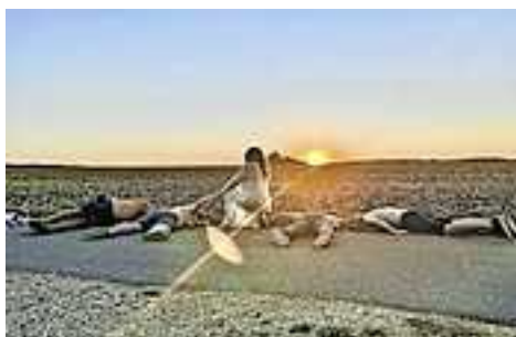
Die Liveband „6feet2“ sorgt bei der After-Race-Party für ordentlich Stimmung

Nach den sportlichen Aktivitäten wartet ein weiteres Highlight: die große After Race Party mit der Liveband „6feet2“. Hier können alle Läuferinnen, Läufer