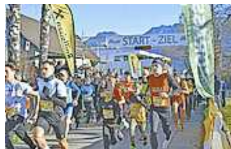
Zahlreiche Läufer nutzen den Silvesterlauf auch heuer für einen sportlichen Jahresabschluss.

Die Anmeldung für den Silvesterlauf ist immer noch geöffnet und erfolgt online unter www.altacher-silvesterlauf.at . Kurzentschlossene haben bis jeweils eine Stunde vor dem jeweiligen Lauf die