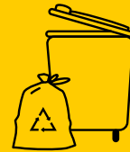
GELBE TONNE & GELBER SACK