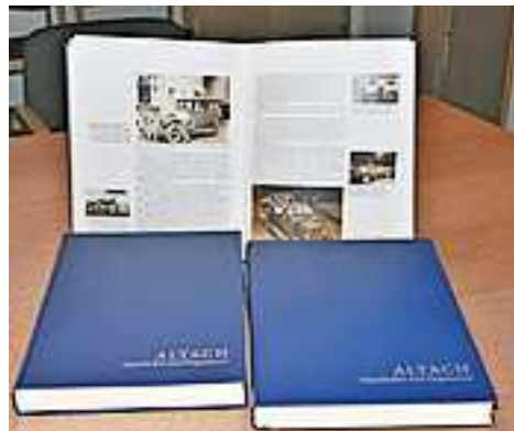
Das Altach-Buch ist beim Bürgerservice im Gemeindeamt erhältlich.