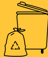
GELBE TONNE & GELBER SACK