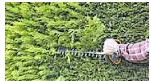
Ordnungsgemäß zurück geschnittene Hecken sehen nicht nur schön gepflegt aus, sondern tragen auch zu mehr Sicherheit bei.

auch die Passanten. Gerade bei Gehsteigen, Ausfahrten oder in der Nähe von Verkehrsschildern können Sichtbehinderungen zu gefährlichen Situationen führen. Passiert ein Unfall infolgedessen, kann der Eigentümer sogar haftbar gemacht werden. Um die notwendige Sicherheit zu gewährleisten, ist es daher unumgänglich, dass die Sträucher und Hecken ordnungsgemäß zurückgeschnitten werden.