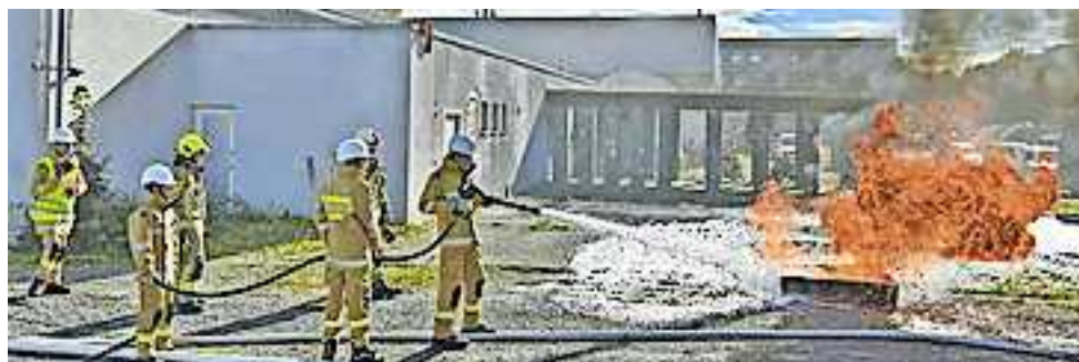
Die Jugendfeuerwehr Altach zeigt bei der Vereinsmesse ihr Können

trum an Freizeitaktivitäten und Ehrenamt in der Gemeinde zu informieren. Egal ob Sport, Musik, Kultur oder soziale Initiativen – für jeden ist etwas dabei. Besondere Highlights sind die Autogrammstunde des Fußballclubs SCR Altach sowie die musikalischen Darbietungen der Jugendkapelle und des Kirchenchors. Auch die Vorführungen der Feuerwehr Altach im Außenbereich werden spannende Einblicke in deren Arbeit bieten. Die Vereinsmesse ist ein idealer Treffpunkt für alle, die sich über das Altacher Vereinsleben informieren oder Teil davon werden möchten. Die Gemeinde Altach freut sich auf zahlreiche Besucher.