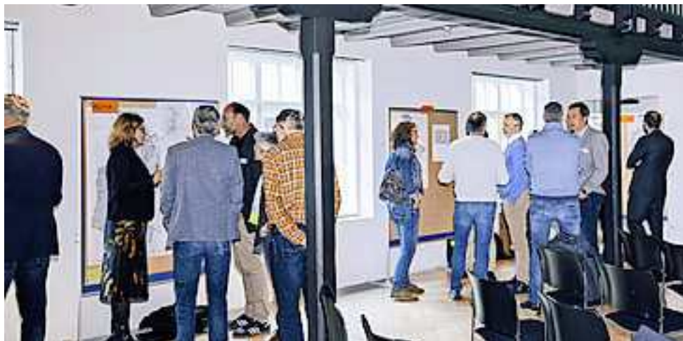
Alle Infos unter www.agglomeration-rheintal.org

Die entsprechenden Dokumente sind auf der Website der Agglo Rheintal einsehbar unter: www.agglomeration-rheintal.org/oeffentliche-mitwirkung-ap5