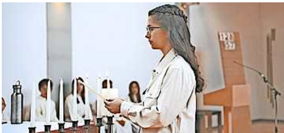
Die Firmvorbereitung startet im Oktober

Das Startfest zur Firmung ist am 11. Oktober um 19 Uhr im Pfarrzentrum Altach. Die Firmlinge erwarten eine spannende Zeit mit neuen Erfahrungen und Kontakten. Wir freuen uns sehr, wenn wir viele neue Firmlinge begleiten dürfen. Das Firmteam der Pfarre Altach.