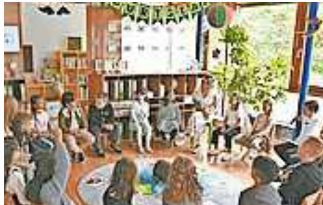
Die Kinder machten sich mit den Pädagoginnen und dem Klassenzimmer vertraut

sen begann damit ein neuer Lebensabschnitt. Insgesamt werden an der Volksschule Altach im kommenden Schuljahr 330 Schüler unterrichtet. Auch an der Mittelschule fiel am Montag der