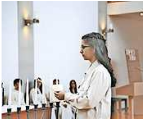
Die Firmvorbereitung startet im Oktober

Im Oktober beginnt der nächste Firmweg der Pfarre Altach für diejenigen, die nächstes Jahr 17 Jahre alt werden. Ebenso herzlich sind alle nicht gefirmten Erwachsenen (18+) eingeladen, die sich für diesen Weg entscheiden. Mehr Infos und die Termine sind auf der Homepage der Pfarre Altach https://www.kath-kirche-vorarlberg.at/pfarren/altach/firmung ersichtlich. Die Anmeldung zur Firmung ist simpel. QR-Code scannen und das Online-Formular ausfüllen. Falls dies digital nicht möglich sein sollte, kann ein analoges Formular beim Anmeldegespräch verwendet werden. Das Startfest zur Firmung ist am 11. Oktober um 19 Uhr