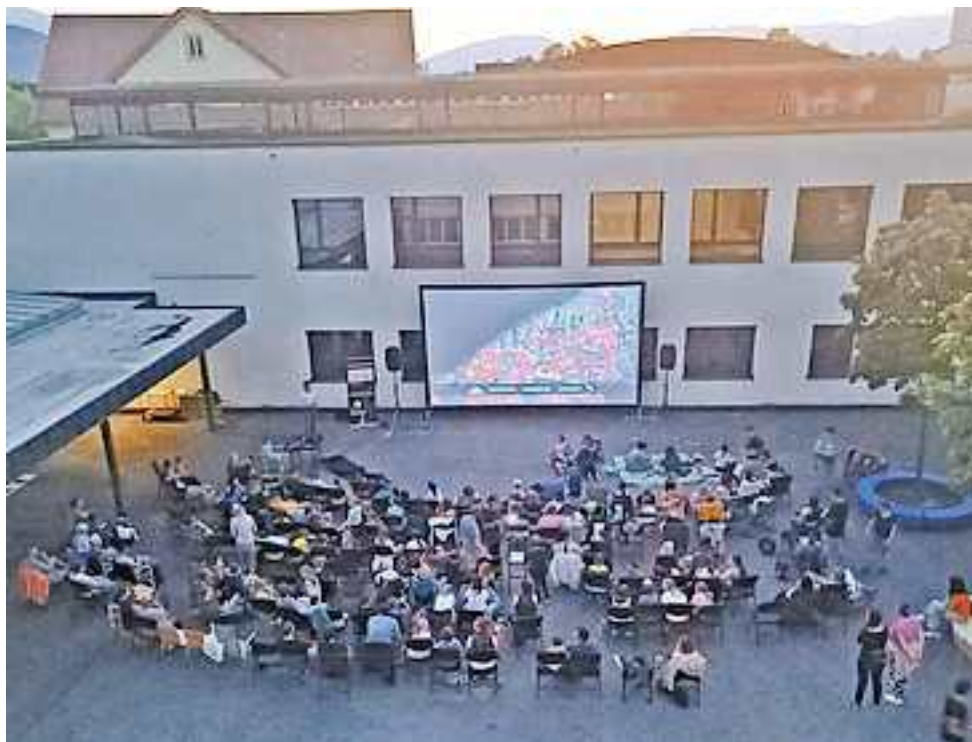
Der Pausenplatz der Mittelschule verwandelt sich in einen großen Kinosaal

„Encanto“ ist für Zuschauer jeden Alters geeignet (FSK 0), und damit ein Erlebnis für die ganze Familie. Der Altacher Sommer findet mit diesem Open Air Kino einen gebührenden Abschluss.