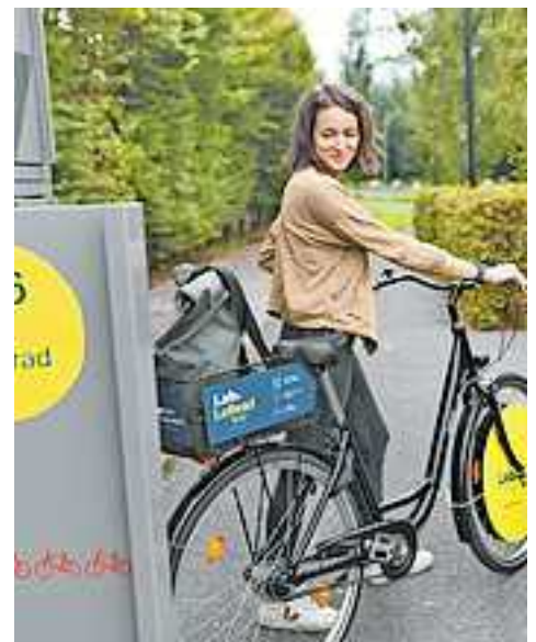
Im Rahmen der VMOBIL Woche können Leihräder gratis getestet werden.

Gewinne mit etwas Glück tolle Preise wie z.B. ein KlimaTicket VMOBIL maximo. Gewinnformular ausfüllen und schon bist du bei der Verlosung dabei! Alle Details zur VMOBIL Woche findest du unter www.vmobil.at/vmobilwoche .