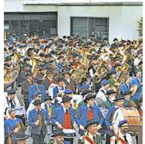
Weitere Infos unter www.vbv-blasmusik.at.

Im Anschluss lädt der Verband zum Brückenfest auf dem Parkplatz bei den Koblacher Sportstätten mit der böhmischen Brasspartie „Die 4 Beiden!“. Die Teilnehmer stehen sich Schulter an Schulter über vier Kilometer entlang des Rheins gegenüber, verbunden durch die Brücke. „Hier geht es um die Verbindung durch die Musik über die Landesgrenzen hinweg: So eine Aufstellung zum gemeinsamen Spiel hat es noch nie gegeben“, so VBV-Obmann Wolfram Baldauf.