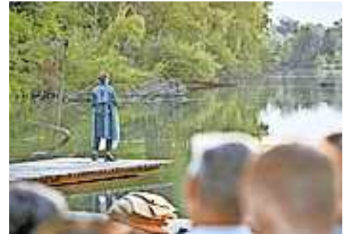
Premiere des „Theater im Kies“ 2023

Zeno selbst fügt hinzu: „Ich wurde mit offenen Armen in die Gruppe aufgenommen. Die harmonische und herz-