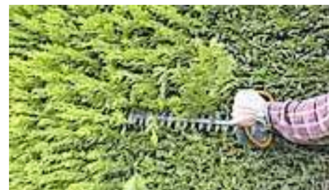
Ordnungsgemäß zurück geschnittene Hecken sehen nicht nur schön gepflegt aus, sondern tragen auch zu mehr Sicherheit bei.

auch die Passanten. Gerade bei Gehsteigen, Ausfahrten oder in der Nähe von Verkehrsschildern können Sichtbehinderungen zu gefährlichen Situationen führen. Passiert ein Unfall infolgedessen, kann der Eigentümer sogar haftbar gemacht werden. Um die notwendige Sicherheit zu gewährleisten, ist es daher unumgänglich, dass die Sträucher und Hecken ordnungsgemäß zurückschnitten werden.