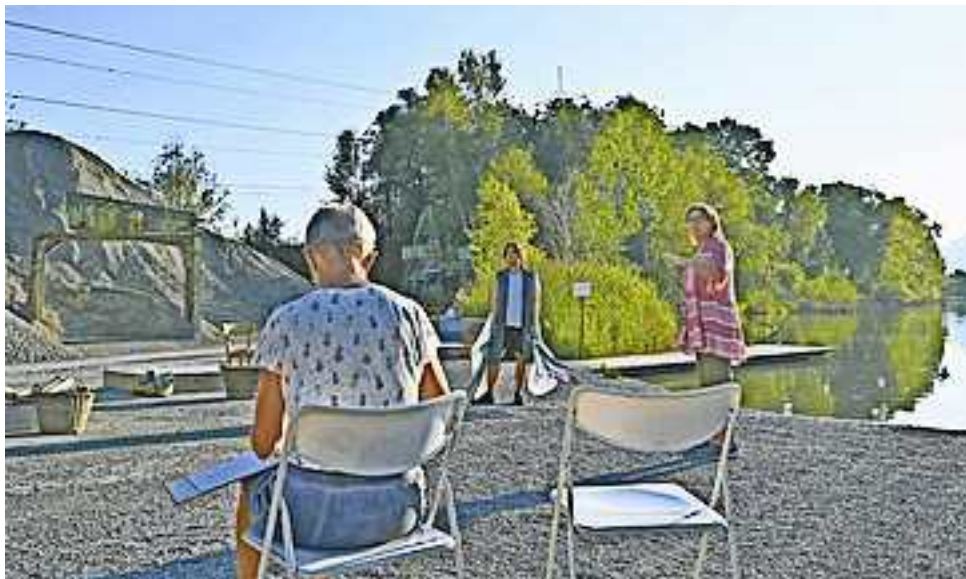
Weitere Fotos auf www.facebook.com/stadthohenems.

Der Aufwand ist enorm. Bereits im Februar fanden die ersten Besprechungen statt, seit April wird mindestens zweimal wöchentlich geprobt. Bis zur Premiere am Mittwoch, dem 14. August 2024, bleibt aber noch ein wenig Zeit. Die nächsten Tage und Wochen werden deshalb für das „Ausputzen“ der einzelnen Szenen genutzt. Unterstützt wird Regisseurin