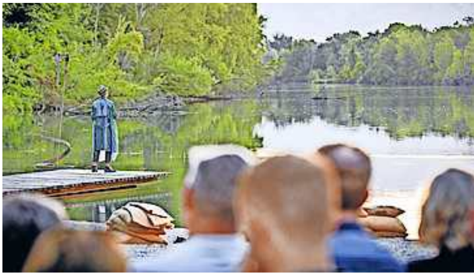
Informationen um Stück und zu den Vorstellungsterminen im August finden Sie unter www.theaterimkies.at.

Wenn Sie Interesse haben, nehmen Sie gerne mit dem Kulturreferat der Stadt Hohenems Kontakt auf unter Tel. 05576/7101-1250 oder E-Mail kultur@hohenems.at