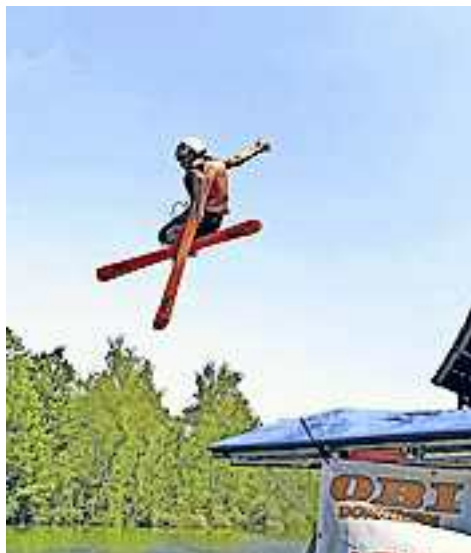
Schanzensprünge im Freestyle Zentrum, die begeistern.

Das Wetter war dem Event wohlgesonnen: Bewegungsspiele, Bodenturnen, Übungen auf verschiedenen Trampolins und die beliebten Schanzensprünge,