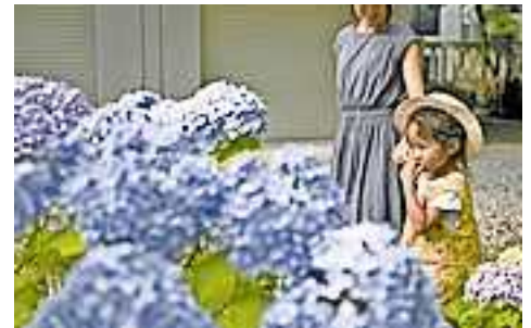
Weitere Informationen und eine Auflistung giftiger Pflanzen sind unter www.sicheresvorarlberg.at zu finden.

Werden versehentlich geringe Mengen giftiger Pflanzen bzw. deren Bestandteile eingenommen, kann es zu Schleimhautreizungen und Magen-Darm-Problemen sowie Rötungen, Juckreiz und Bläschen bei Hautkontakt kommen. Sind größere Mengen bzw. stark giftige Pflanzen verzehrt worden, kommt es unter Umständen zu schweren Symptomen.