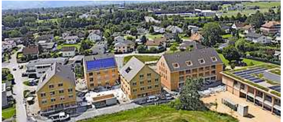
Das Quartier im Kreuzfeld nimmt Form an

Es gibt verschiedene Voraussetzungen für eine Bewerbung: Der Bewerber muss bis zum Zeitpunkt der Vergabe