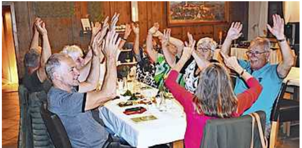
Beste Stimmung beim Unterhaltungsabend im Hotel