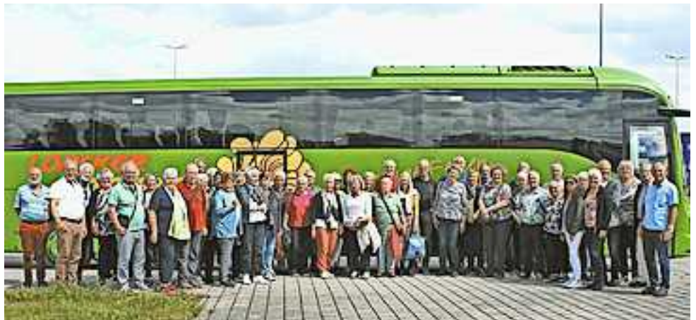
Die Reisegruppe von Altach50plus