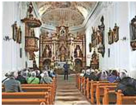
In der Barockkirche in Bad Leonfelden