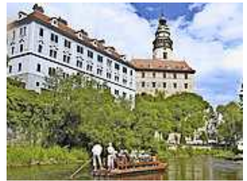
Mit dem Floß auf der Moldau in Krumau