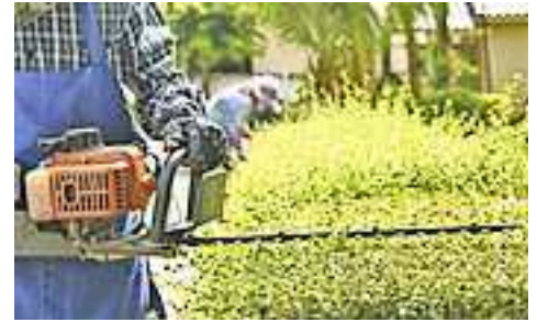
Ordnungsgemäß zurück geschnittene Hecken tragen zu mehr Sicherheit bei

Bäume und Sträucher, die auf Straßen und Gehsteige hinausreichen, sind nicht nur sichtbehindernd, sondern stören auch die Passanten. Gerade bei Gehsteigen, Ausfahrten oder in der Nähe von Verkehrsschildern können Sichtbehinderungen zu gefährlichen Situationen führen. Passiert ein Unfall infolgedessen, kann der Eigentümer