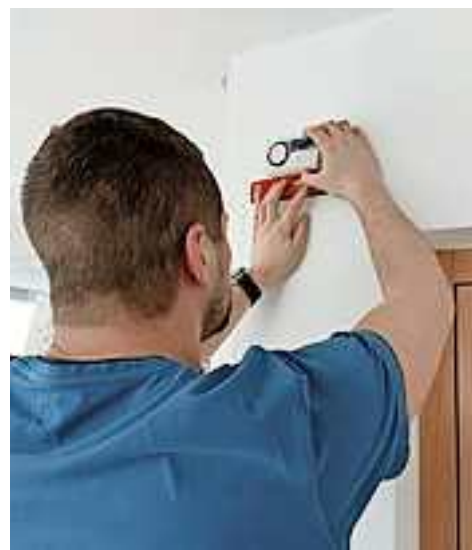
Montage eines Kohlenmonoxid-Melders

Weitere Infos unter www.sicheresvorarlberg.at