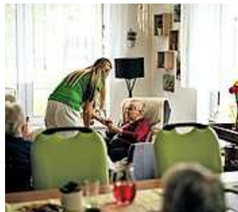
Weiteren Veranstaltungen im Rahmen von „Pflege im Gespräch“ unter www.connexia.at