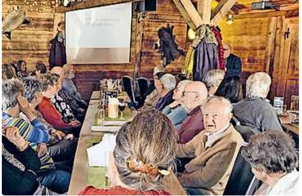
Mitglieder der OG-Altach des Pensionistenverbandes