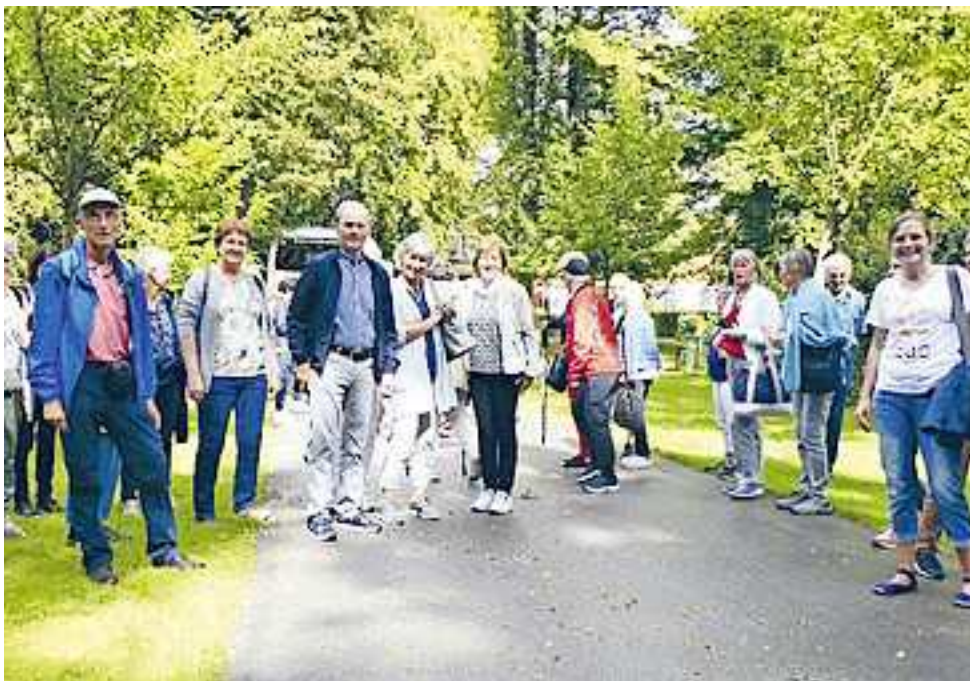
Vereinsausflug 2021 an die Wirkstätte von Pfarrer Kneipp nach Bad Wörishofen

dafür allen herzlichen Dank, die sich ehrenamtlich und gemeinnützig einbringen. Geehrt und gedankt hat der Vorstand mit einem kleinen Präsent langjährigen Vereinsmitgliedern für ihre Treue. Ein besonderer Höhepunkt im Vereinsjahr 2024 wird im September der Tagesausflug mit der Karwendelbahn nach Mittenwald sein und wir hoffen auf eine große Teilnahme. Infos und Anmeldungen gerne bei den Vorstandsmitgliedern. Eine Fotoshow über das vielfältige Vereinsleben der letzten 15 Jahre rief bei den Gästen manch schönes Erlebnis in Erinnerung. Abschließend wurden die Besucher vom Catering Mike Häfele, über Einladung des Vorstandes, mit Gulasch, Spätzle und Gemüseplatte verwöhnt.