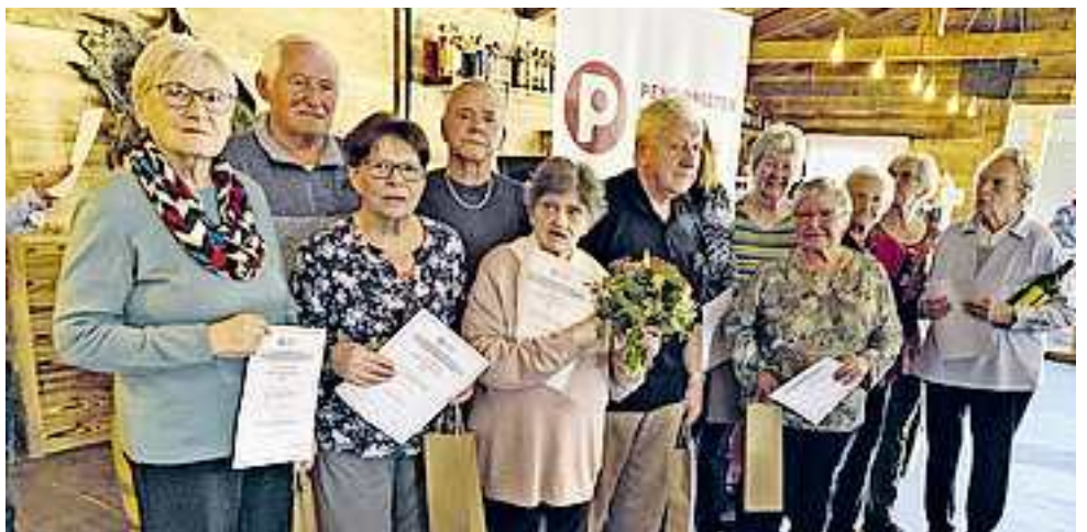
Die frischgebackenen Jubilarinnen und Jubilare