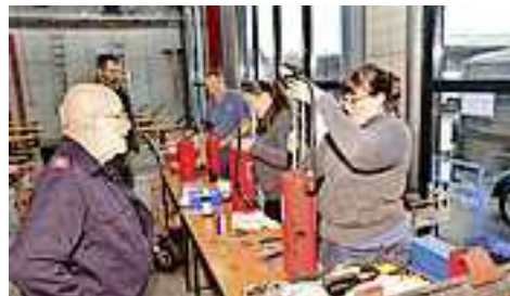
Im Zuge der Landschaftsreinigung findet im Feuerwehrhaus auch die Überprüfung der Feuerlöscher statt.

von Feuerlöschern zur Verfügung. Direkt vor Ort können auch Rauchmelder erworben werden.