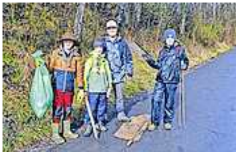
Die Gemeinde hofft auch in diesem Jahr wieder auf die Mithilfe der zahlreichen Ortsvereine.

auch die Feuerlöscher Überprüfung auf dem Programm. Im Feuerwehrhaus stehen Experten für die Kontrolle