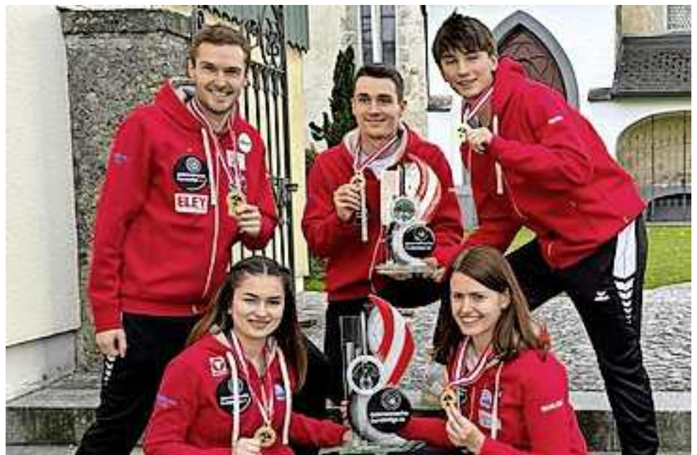
Das erfolgreiche Team der Union Schützengilde Altach.

Nach der bisherigen Saisonleistung der USG Altach inklusive dem am Freitag erzielten neuen Bundesligarekord