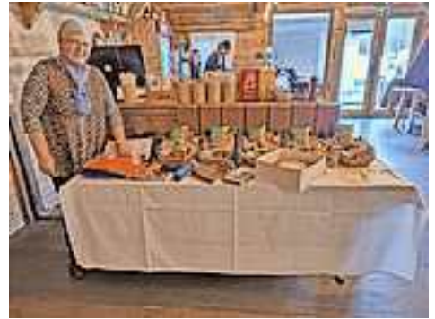
Ein Tisch voller schöner Preise.