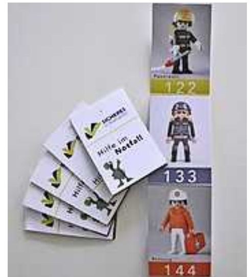
Eine Initiative von Sicherem Vorarlberg.

Die Notfallkarten können kostenlos bei Sicherem Vorarlberg unter E-Mail info@sicheresvorarlberg.at bestellt werden.