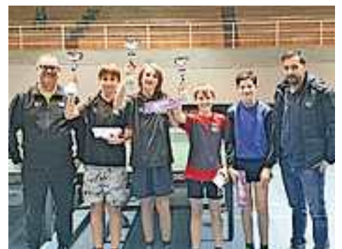
Die besten Spieler im U15 Bewerb