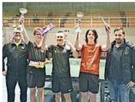
Die Titelträger im U19 Bewerb